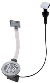
Automatischer Abfluss - PM 8407 113