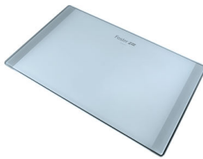
Schneidebrett aus Glas 8633 300

* nur in Kombination mit dem Zubehör 8644 101