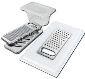
Satz Reibe mit Halterung für Ring und Auffangschale 8159 101

* nur in Kombination mit dem Zubehör 8644 101