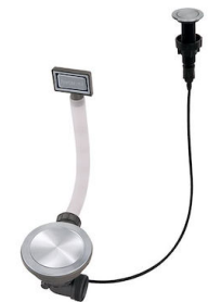
Automatischer Abfluss Space Push - PP 8407 116