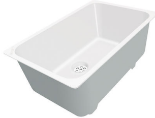
Weißer Wanne 8153 100

* nur in Kombination mit dem Zubehör 8644 101